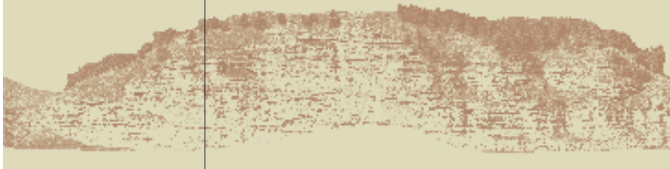
Cortado del Castillo 77 bocas