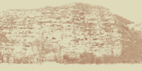
Cortado de Santa Lucía 18 bocas